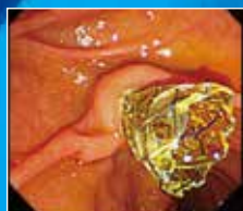
胆管ステント留置術